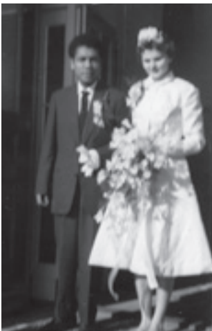
Trouwfoto uit 1960.