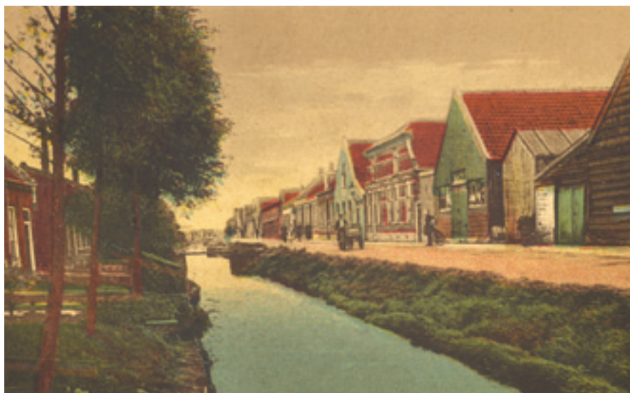
Een blik op de Noordkade richting Boskoop, zo te zien het betere deel