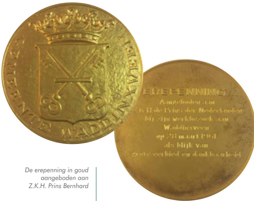
De erepenning in goud aangeboden aan Z.K.H. Prins Bernhard